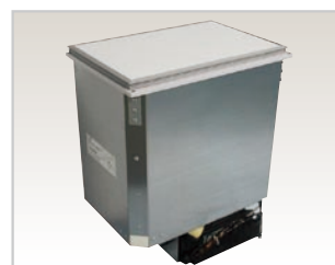
ビルトイン冷凍・冷蔵庫 MB40V (内容積 40L)