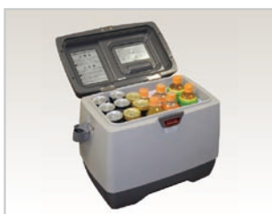
冷凍・冷蔵・温蔵庫 MHD14F (内容積 14L)

レジャーや業務・家庭用として、バッテリーでも使える本格派AC/DC 冷蔵庫、フリーザーなどを提供しております。乗用車、トラック、バス、キャンピングカー、クルーザーなど、幅広い用途でご利用いただいております。