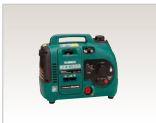
SHX1000 (定格0.9kVA/50,60Hz, 単相)

世界各国の電圧・周波数の仕様に合わせ、ガソリン・ディーゼルおよびガス発電機を0.9kVA から25kVA までの出力範囲で提供しております。