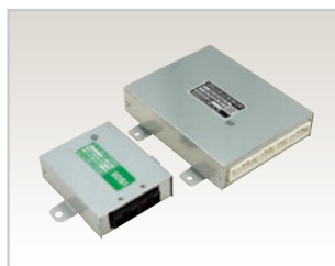
車載用コンピュータ