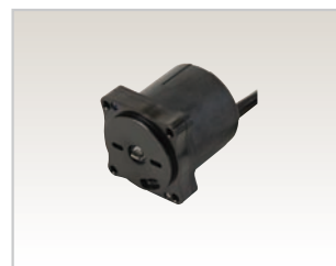
DC モータ 12V-400W