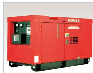
SHT25D (定格20kVA/50Hz, 三相) (定格22kVA/60Hz, 三相)