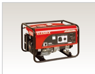
SH7600EX (定格5.6kVA/50Hz, 単相) (定格6.5kVA/60Hz, 単相)