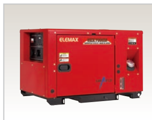
SHX7000Di (定格7.0kVA/50,60Hz, 単相)