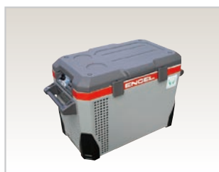
冷凍・冷蔵庫 MR040F (内容積 38L)