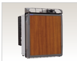
冷凍・冷蔵庫 SB47F (内容積 40L)