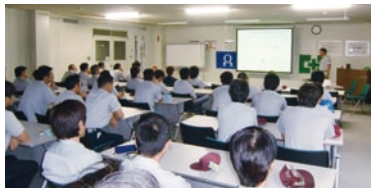
新入社員の安全衛生教育

新入社員安全衛生教育(4月)をはじめフォークリフト安全教育(10月)、管理監督者リスクアセスメント教育(11月)などに積極的に取り組み、安全衛生に対する心構えなど意識高揚活動を実施しています。