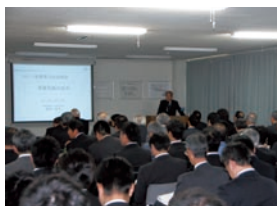
購買方針説明会での社長挨拶

2011年度の開催では、仕入先様112社の代表者のご出席をいただき、2011年度購買方針をご説明するとともに、最重要課題である安全、品質、原価改善、危機管理体制の確立についてのご協力をお願い致しました。