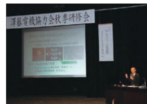
澤藤電機協働会秋季研修会