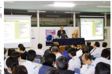
メンタルヘルス研修会