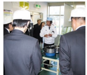
技術講習会後の工場見学