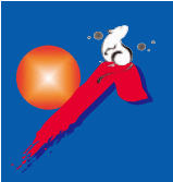
燦燦活動ロゴマーク

全員参加型のボトムアップ活動を「燦燦活動」と称して、2006年12月より工場部門を皮切りに、その後間接部門も含め全社一丸となって活動を展開しています。これは、文字通り、澤藤を太陽のように明るく光り輝くようにしたい、なりたいとの思いから全社で取り組む活動です。燦燦活動の心は、次の通りです。