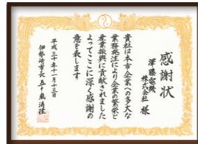
伊勢崎市産業振興貢献企業感謝状