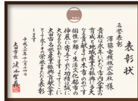
太田市産業振興貢献企業表彰状

地域社会との交流を深めるために、福祉施設の皆様との交流会や工場周辺の清掃活動、ボランティア活動、地域イベントへの参加などを行っています。