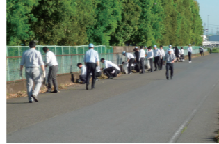
工場周辺の清掃活動