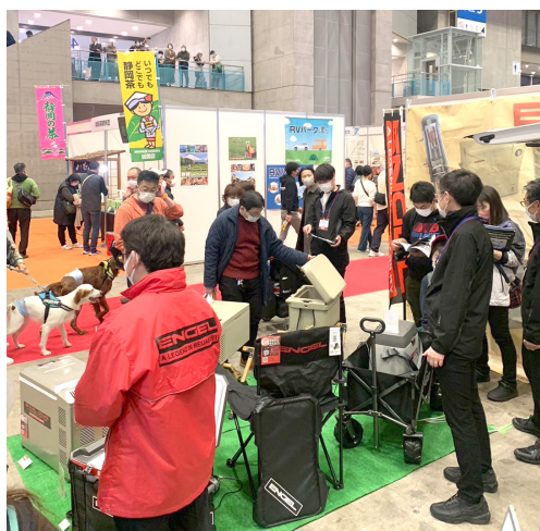
お客様来場の様子

次回以降のショーについても引き続き、さまざまな製品展示やお客様に喜ばれるサービス拡充に努めてまいります。