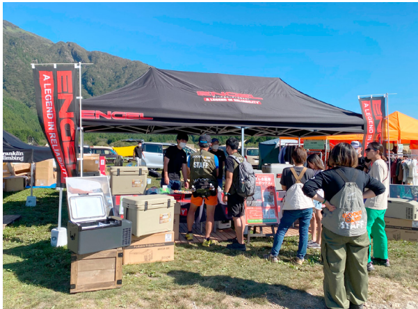
お客様来場の様子

今後もこのようなイベントに積極的に参加し、キャンパーの皆様に当社ブランドの訴求、コトづくり提案を実施してまいります。