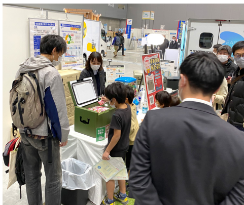
澤藤出展ブースの様子