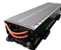
※3 バッテリーパック

澤藤電機株式会社は、商用車部品専門メーカーとしていち早くCO 2 排出量の削減に貢献するため、2016年から小型HVモーター（出力36kW）・大型HVモーター（出力90kW）の組立設備を順次新規導入、バッテリーパックの生産ラインを設置し、ハイブリッドトラック等の車両用電動化ユニットの生産ラインを稼働しております。