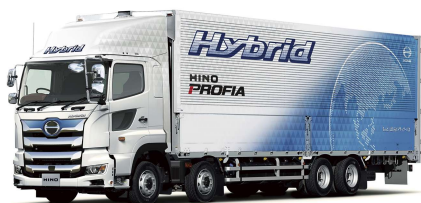
※1 日野プロフィア ハイブリッド

澤藤電機株式会社（本社：群馬県太田市、代表取締役社長：吉川 昭彦）は、2019年5月より日野自動車株式会社（本社：東京都日野市、代表取締役社長：下 義生）の大型ハイブリッドトラック「日野プロフィア ハイブリッド※1」向けに大型ハイブリッドモーター※2（以下、HVモーター）、バッテリーパック※3の生産・販売をしております。この度、当該製品が採用されている「日野プロフィア ハイブリッド」が、一般財団法人 省エネルギーセンター主催「2020年度 省エネ大賞」の最高位となる経済産業大臣賞（輸送部門）を受賞されましたのでお知らせいたします。